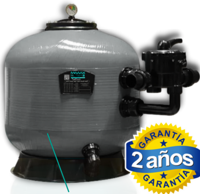
Fibra de Vidrio

Los filtros de arena con válvula multiport lateral de Global Pacific le proveerán agua limpia y clara para usos comerciales y privados. Estos filtros producen mayor cantidad de agua filtrada con menor caballaje de bombeo.