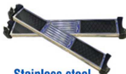
Stainless steel anti-slip pedal